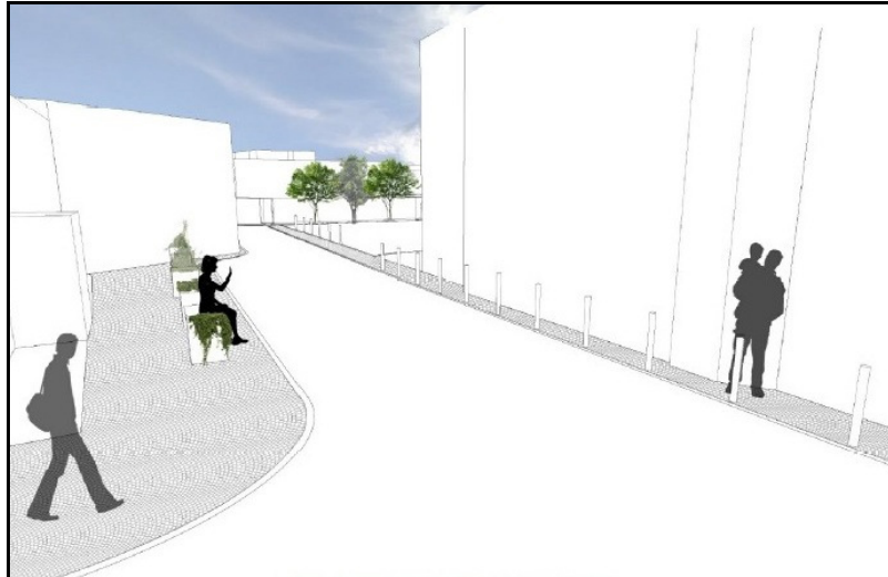
Prospettiva Via Crespi Antonietti in prossimità dell'incrocio con Via IV Novembre

Anche per l'ingresso in Piazza Roma è prevista la delimitazione degli spazi pedonali che verranno pavimentati con cubetti di porfido e attrezzati con fioriere, panchine e porta biciclette.